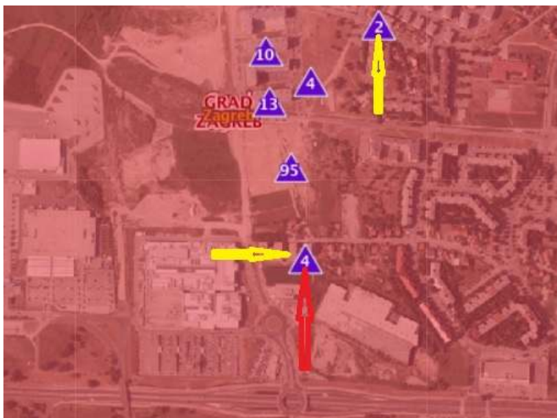
Lokacija procjenjivane i usporednih nekretnina

PGM u Zagrebu, Savska Opatovina bb, površine 6,85 m 2 u zgradi građenoj 2009. godine. Kupoprodaja obavljena 27.01.2016. za iznos od 84.320,52 kn. Nekretninu smo pregledali, a za sve ostale podatke služili smo se javno dostupnim izvorima (internet).