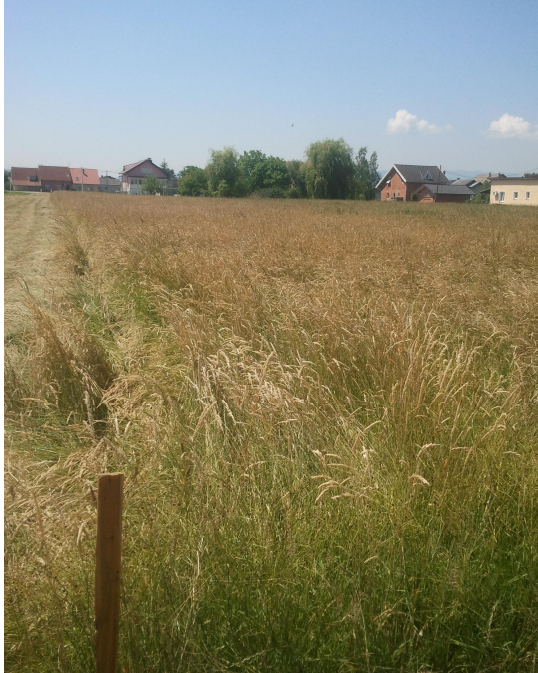
pogled iz ulice J. Anića