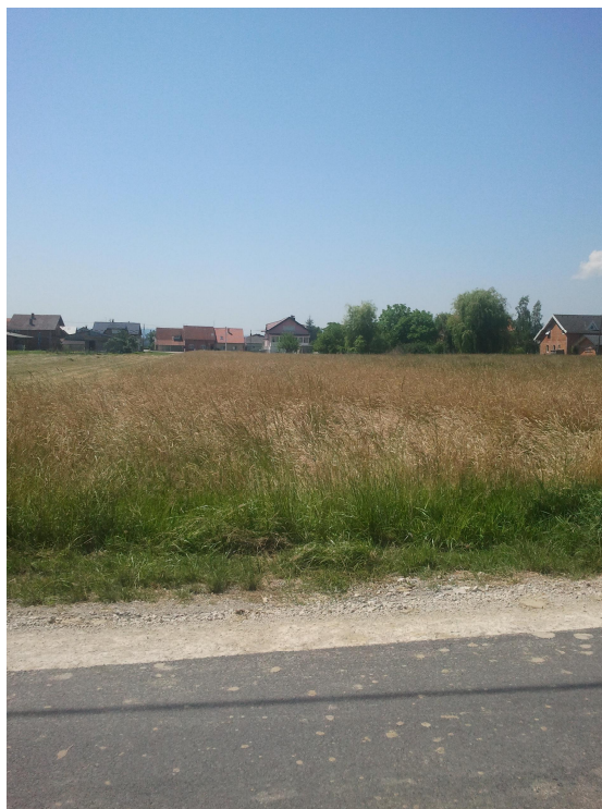
ulica J. Anića

Parcela je pravilnog izduženog pravokutnog tlocrtnog oblika, orijentacije jug – sjever, a nalazi se između dvije javne prometnice. Direktno se pristupa s južne strane iz Bregovite ulice te sa sjeverne strani iz ulice J. Anića..